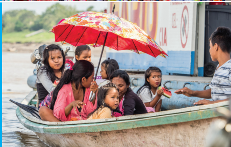
Lidé z kmene Ticuna. Jsou nejpočetnějším kmenem v brazilské Amazonii – tento kmen žije v Peru, Kolumbii a Brazílii.