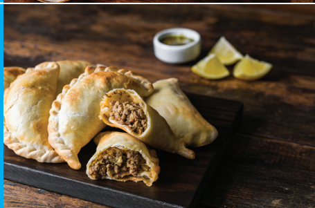
Tradiční argentinské pečivo – taštičky plněné hovězím masem