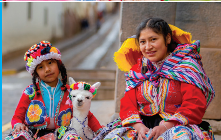
Peruánské dívky s mládětem lamy v ulicích Cusca (Peru)