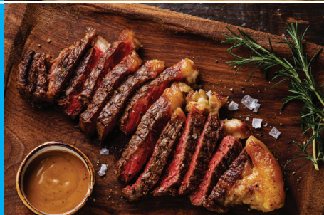
Argentinský steak z hovězího masa. Argentinské hovězí je jedno z nejchutnějších na světě.