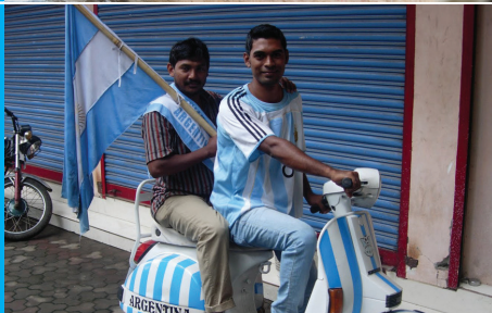
Dva muži na skútru v barvách argentinské vlajky.