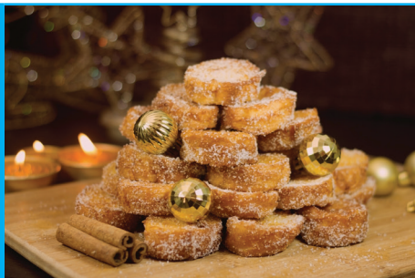
Rabanadas – tradiční vánoční cukroví (Brazílie)