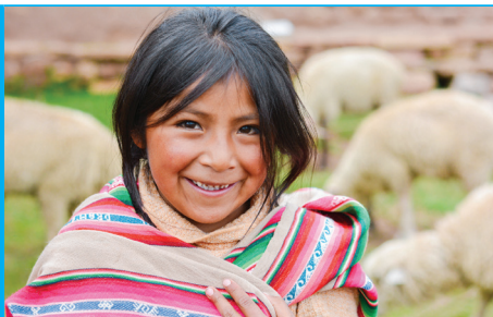
Malá holčička z farmářské rodiny (Bolívie)